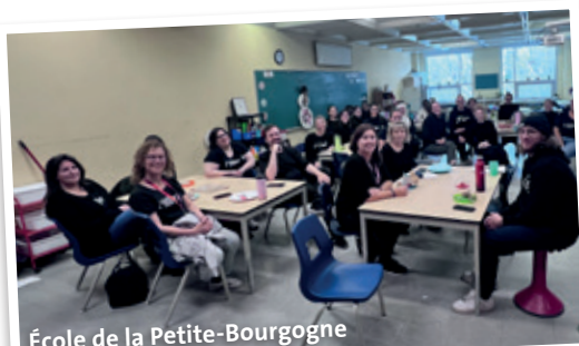
École de la Petite-Bourgogne

LE CSSDM N'ÉCOUTE PAS LES PROFS ! IL EST TEMPS DE SE FAIRE ENTENDRE.