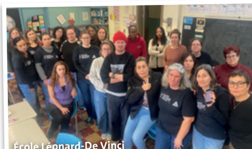
École Léonard-De Vinci