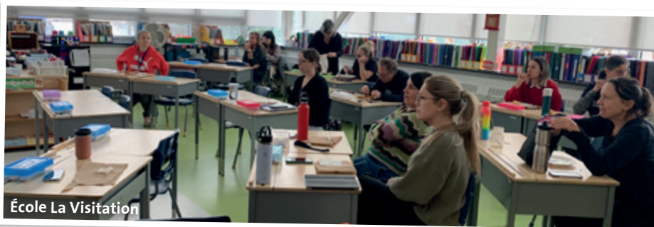
École La Visitation