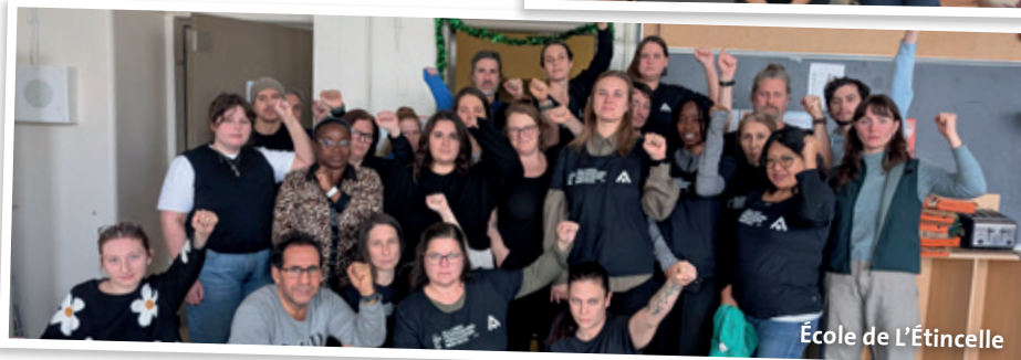
École de L'Étincelle