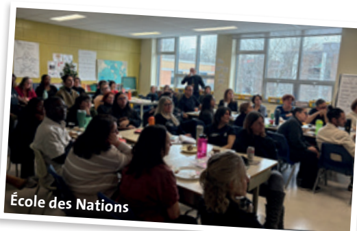
École des Nations