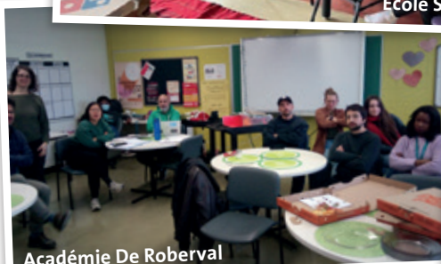
Académie De Roberval