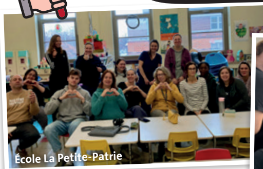
École La Petite-Patrie

LE CSSDM N'ÉCOUTE PAS LES PROFS ! IL EST TEMPS DE SE FAIRE ENTENDRE.